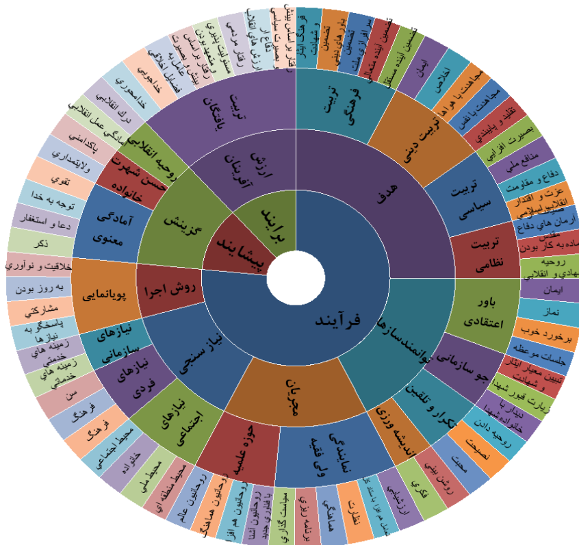
شکل ۱: مدل نهایی پژوهش

در نهایت پس از احصای اقدامات و سیاستهای متناسب با مؤلفه های استخراج شده، در راستای تحقق تربیت عقیدتی سیاسی نیروهای مسلح تمدن ساز، الگوی ذیل ترسیم شد.