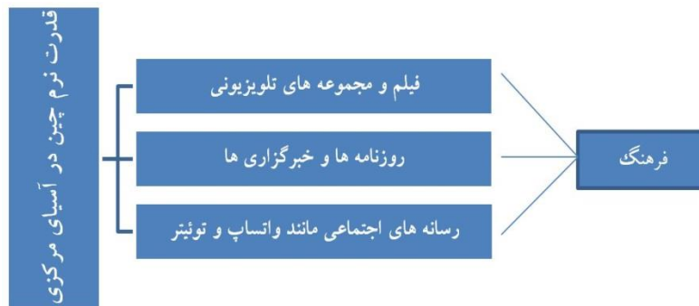
شکل ۱. الگوی نظری پژوهش

بررسی شده است. به عنوان مثال، در مورد مبنای تقسیم بندی رسانه ها در قالب دیپلماسی عمومی و کاربرد آن می توان به دولت ایالات متحده اشاره نمود. در همین ارتباط، ایالات متحده به کاربرد قدرت نرم خود در مناطق مختلف جهان همچون کشورهای عربی به عنوان بخشی از یک برنامه رسمی دیپلماسی عمومی پرداخته است. همچنین در مورد چگونگی مواجهه با چالش ها و استفاده از قدرت نرم بحث شده است (Rugh, 2017: 4). این مطالعه به روشن شدن این سوال گسترده تر کمک می کند که قدرت نرم چین در آسیای مرکزی به چه نحوی بوده و دارای چالش هایی می باشد. استفاده از ابزار تحلیل قدرت نرم از اهمیت ویژه ای برخوردار است، زیرا به ما کمک می کند تا از تغییر قدرت مداوم بهره مند شویم. این موضوع همچنین شامل چگونگی توسعه و حفظ نقش چین در آسیای مرکزی، و نیز کشف چالش های موجود است (Weissmann, 2020: 354). در ادامه الگوی نظری پژوهش با توجه به قدرت نرم چین در آسیای مرکزی ارائه شده است: