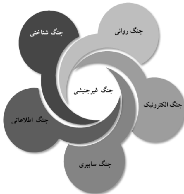
شکل ۲. جنگ‌های غیر جنشی

اگرچه شباهت‌های مختلفی بین جنگ شناختی با سایر مصادیق جنگ غیر جنشی نظیر جنگ روانی، جنگ سایبری، جنگ اطلاعاتی و جنگ الکترونیک وجود دارد اما در نهایت در اجرا و هدف خود منحصر به فرد است، لذا در ادامه به بررسی وجوه تمایز جنگ شناختی با سایر جنگ‌های غیر جنشی می‌پردازیم.