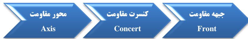
شکل ۳. مدل فرآیندی تشکیل جبهه مقاومت

جدایی طلب، افراط‌گرایی و فرقه‌گرایی قومی- مذهبی، و در نتیجه حفظ تمامیت ارضی از اصول خدشه‌ناپذیر این کنسرت مقاومت خواهد بود و برای دستیابی به این مهم لازم است تمام اعضاء در خصوص تشکیل نوعی رژیم بین‌المللی مقاومت در حوزه دفاعی و امنیتی به توافق برسند. ضمناً ایجاد کنسرت منسجم مقاومت مقدم بر تشکیل جبهه متحد مقاومت است اما پس از تشکیل محور همسوی مقاومت.