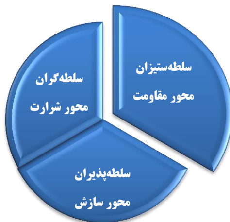
شکل ۲. تقسیم‌بندی نظام بین‌الملل با منطق مقاومت

اصولاً با منطق انقلاب اسلامی کشورها به سه دسته کلی تقسیم می‌شوند: کشورهای «سلطه‌گر»، کشورهای «سلطه‌پذیر» و کشورهای «سلطه‌ستیز». تنها گزینه کشورهای سلطه‌ستیز، مقاومت در برابر کشورهای سلطه‌گر و دعوت کشورهای سلطه‌پذیر به خروج از سلطه و پیوستن به کشورهای سلطه‌ستیز جهت تشکیل جبهه مقاومت جهانی است. مقاومت را می‌توان در این چارچوب در دو بُعد داخلی و خارجی ترسیم نمود. چرا که مقاومت خارجی دولت‌ها و مقاومت داخلی ملت‌ها دوروی یک سکه و لازم و ملزوم یکدیگرند.