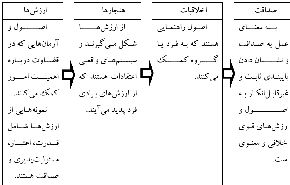
شکل ۱. رابطه بین ارزش‌ها، هنجارها، اخلاق و صداقت

ارزش‌ها، هنجارها، اخلاق و صداقت به‌طور جدایی ناپذیری با یکدیگر مرتبط هستند. ارزش‌ها پایه و اساس هنجارها، اخلاق و صداقت را تشکیل می‌دهند. هنجارها کمک می‌کنند تا در مورد اینکه چگونه باید بر اساس ارزش‌ها عمل شود، تصمیم گرفته شود. اخلاق راهنمایی عملی برای پایبندی به ارزش‌ها و اخلاقیات هستند. صداقت نشان‌دهنده ثبات و عدم انعطاف‌پذیری در پایبندی به ارزش‌ها، هنجارها و اصول اخلاقی است.