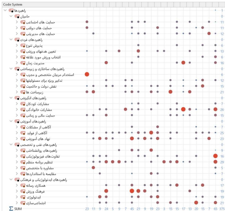
شکل ۱. ماتریس شنون راهبردهای سبک زندگی ورزشی بانوان ایران

پس از کشف و استخراج گزاره‌های اولیه و مفاهیم و مقولات اصلی مربوط به هدف اصلی تحقیق مبنی بر «شناسایی راهبردهای سبک زندگی ورزشی بانوان» با استفاده از رویکرد تحلیل موضوعی، نتایج یافته‌های تحلیل محتوی پنهان مصاحبه‌های انجام شده با خبرگان تحقیق مشاهده گردید که ۱۶۹ گزاره اولیه با مجموع فراوانی ۵۶۵ شامل مضامین در بخش راهبردها و پیامدهای سبک زندگی ورزشی در زنان استخراج گردید که در بخش راهبردها مضامین حامیان، راهبردهای فردی، راهبردهای ساختاری و زیرساختی، راهبردهای انگیزشی، راهبردهای آموزشی، راهبردهای فنی و تخصصی و راهبردهای ایدئولوژیکی و فرهنگی کشف و احصاء گردید. شکل ۱ ماتریس شنون مربوط به مضامین اصلی «راهبردهای سبک زندگی ورزشی در بانوان ایران» است.