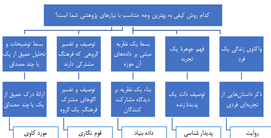
شکل ۱. انواع روش‌های کیفی (کرسول و پوس، ۲۰۱۸) برگرفته از (بیات و سیدطباطبایی، ۱۳۹۹)

حاضر، سازگاری کافی نداشتند و لذا تحلیل مضمون به عنوان روش تحلیل داده‌ها مدنظر قرار گرفته است. شکل زیر که برگرفته از کتاب کرسول ۱ می‌باشد، به خوبی علت این انتخاب را نشان می‌دهد: