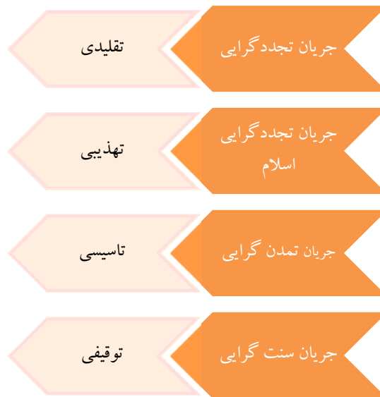
شکل ۱. گونه‌شناسی رویکردها به تولید علوم انسانی با تأکید بر جریان‌های فکری معاصر جهان اسلام

می‌شود؛ جریان تمدن‌گرایی، رویکرد تأسیسی به علوم انسانی اسلامی را می‌پذیرد و بر این باور است که به صورت بنیادین باید به تولید علوم انسانی توجه کرد و در نهایت، جریان سنت‌گرایی، هر چند در برخی از شاخه‌های خود، به رویکرد توقیفی در تولید علوم انسانی باور دارد (شکل ۱).