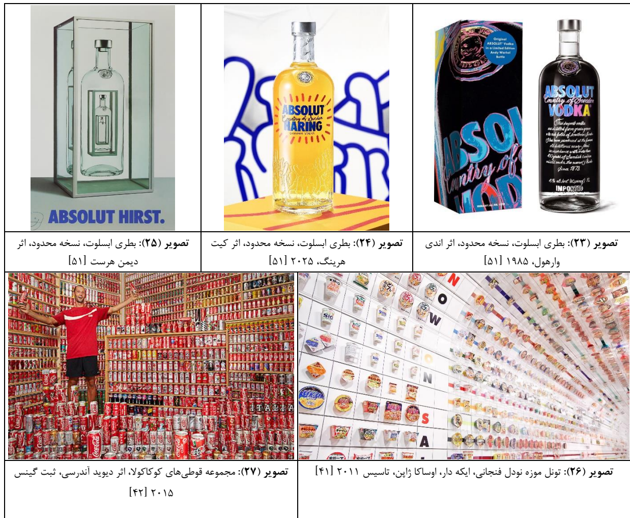
جدول (۷): بازتاب کارکرد بازاریابی طراحی بسته‌بندی (نسخه‌های محدود و مجموعه‌داری) در هنرهای معاصر

گذاشتند. در بلژیک نیز، قوطی‌های «استلا آرتوا» ۵ در حمایت از فستیوال فیلم کن نسخه‌های محدود تولید کرد که هر قوطی با طراحی متفاوتی چاپ شد تا مصرف‌کنندگان را به خیال‌پردازی و داستان‌پردازی دعوت کند. نشان تجاری توبورگ ۶ نیز در آلمان قوطی‌های بزرگ آجو (۷۵۰ میلی‌لیتر تا ۱ لیتر) برای کریسمس ۲۰۱۴ طراحی کرد. نشان‌های تجاری پریر ۷ و باواریا ۸ نیز مانند ابلسوت، از هنرمندان برای طراحی بهره گرفتند [۳۹].