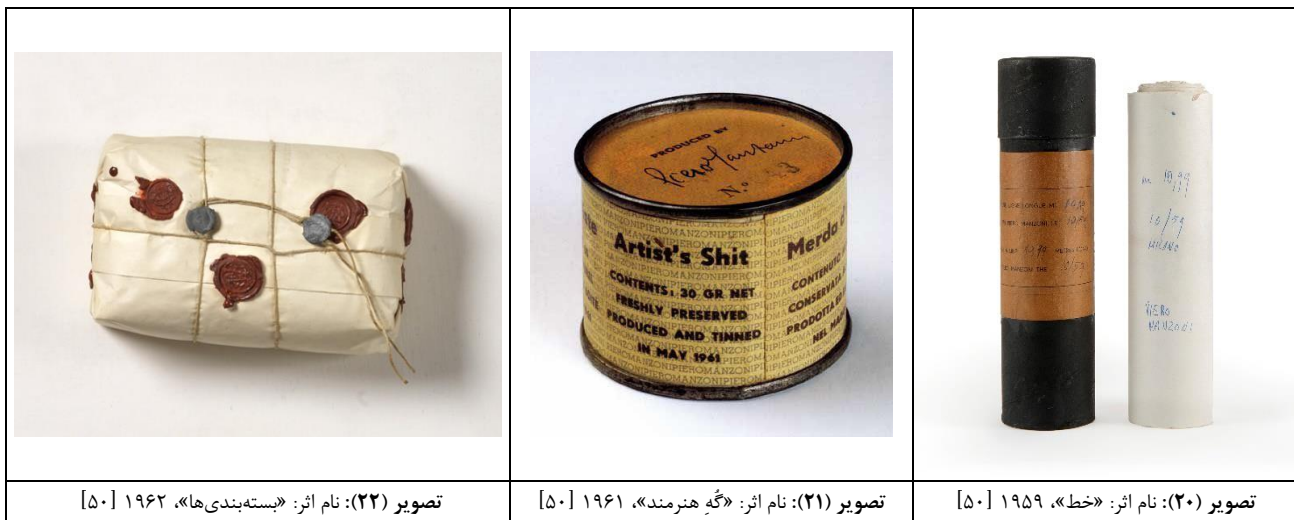
جدول (۶): بازتاب کارکرد بازاریابی طراحی بسته‌بندی (با نگاه انتقادی) در آثار پیرو مانزونی

این جریان شکل گرفتند، اما یک نوع جدید از تولید نسخه‌های محدود، تولید بسته‌بندی‌های مخصوص است نه تولید محصولات مخصوص. از اهدافی که این بسته‌های مخصوص را پدید آورده، می‌توان به جلب توجه مجموعه‌داران، شخصی‌سازی محصول، ارتباط تاریخی و میراثی و تأکید بر کشور سازنده اشاره کرد [۳۷].