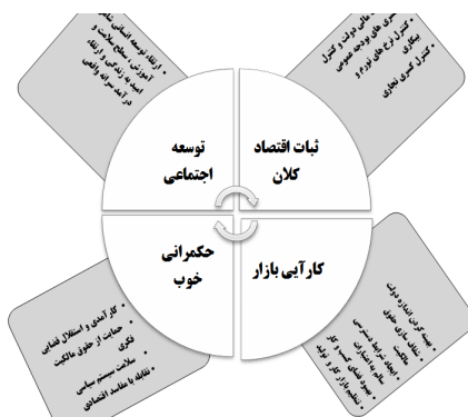
شکل ۲- شرایط لازم برای تاب‌آوری اقتصادی (بریگو گلیو، ۲۰۰۸: ۷)

متغیرهای اصلی تاب‌آوری اقتصادی عبارت‌اند از: اول، متغیرهای اقتصادی که توسط پایداری اقتصادی کلان و کارایی اقتصاد بررسی می‌شوند؛ دوم، متغیرهای اجتماعی - سیاسی که از سوی حکمرانی سیاسی خوب و توسعه اجتماعی مورد بررسی قرار می‌گیرند در شکل ۲ شرایط لازم برای تاب‌آوری اقتصاد و متغیرهای اصلی آن آمده است.