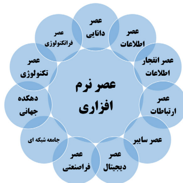
شکل ۱: اوصاف عصر نرم‌افزاری

افزون بر این، در پرتو فناوری‌های ارتباطی جدید، «فضای مجازی» در عرض فضای واقعیت و فضای ذهن ظهور یافته و اکنون همه زندگی فردی و اجتماعی انسان را فراگرفته است. ورود فضای مجازی به زندگی مردم تغییرات شگرفی را در مفاهیم راهبردی حاکمیت، امنیت، قدرت، نفوذ، ارتباطات، زمان، مکان و مرز ایجاد کرده است؛ به گونه‌ای که جوزف نای فضای سایبر را کلید قدرت در قرن ۲۱ می‌داند و می‌گوید امروزه تسلط بر فضای سایبر، قدرت سایبری را در پی خواهد داشت که قدرتی فراتر از قدرت‌های مرسوم است. اگرچه فضای سایبری جای‌گزین فضای جغرافیایی نخواهد شد، انتشار قدرت در فضای سایبری، اعمال قدرت را پیچیده‌تر خواهد کرد (Nye, ۲۰۱۰: ۳). درحقیقت فضای سایبر با گسترش ارتباطات در جهان، امکان نفوذ در جوامع را افزایش داده و ماهیت آن را متحول ساخته است؛ زیرا نفوذ، امری رابطه‌ای است و بدون ارتباط فیزیکی یا مجازی شکل نخواهد گرفت، و ظهور فضای سایبر، به این رابطه به‌طور شگرف‌انگیزی توسعه جهانی داده است: