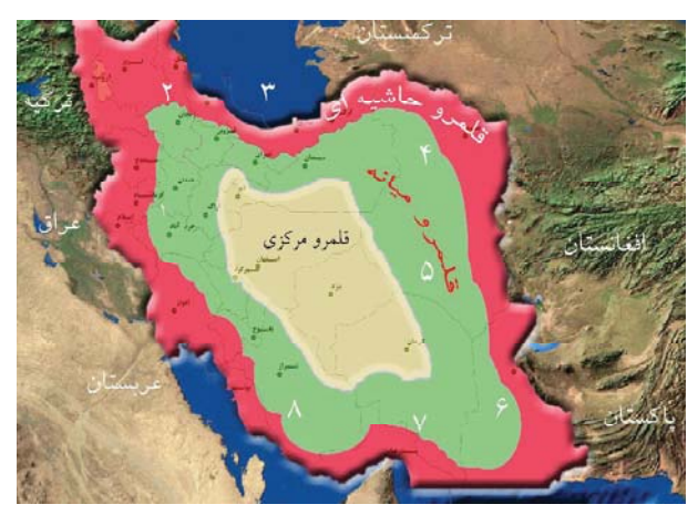
نقشه قلمرو راهبردي- سرزميني

بازدارندگی، دفع تهدید، تأمین منافع ملی، امنیت ملی و منطقهای، توازن قدرت، حمله پیشدستانه، بنیان امپریالی، ایدئولوژیک، تمدنسازی، قدرتسازی، بازتولید قدرت و انجام رسالتش بوده است. ارتقای قدرت ایران، توازن قوا را در منطقه برقرار میکند. هدف غایی دشمنان ایران (هژمونی جهانی) نیز تغییر نظام، تغییر رفتار نظام، تجزیه کشور و تسلط بر منابع و موقعیت ژئوپلیتیک ایران است، ایران نیز برای دفع تهدیدات چارهای جز قدرتسازی ندارد؛ در طول تاریخ، هر وقت ایران قدرتمند بوده، صلح پایدار در منطقه برقرار شده و تهدیدات خنثی شده است [۶].