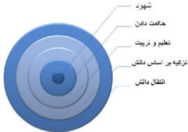
شکل ۱: مراحل ترتیبی نسبت پنج مقوله مورد بحث در آیه ۱۵۱ بقره از ساده و فراگیر به پیچیده و خاص