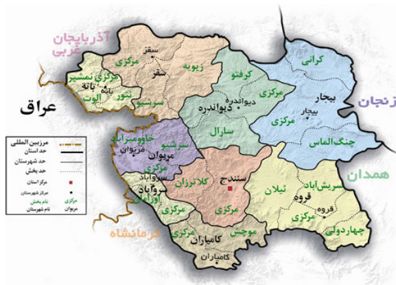
نقشه شماره ۲- تقسیمات سیاسی و موقعیت استان کردستان

بر اساس آخرین تقسیمات کشوری در سرشماری ۱۳۹۰، دارای ۹ شهرستان، ۲۶ بخش، ۲۳ شهر و ۱۷۳۲ آبادی دارای سکنه بوده است(سایت استانداری استان کردستان: ۱۳۹۲).