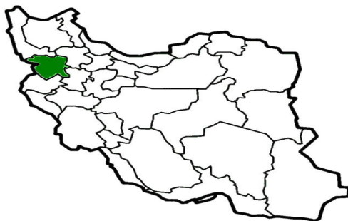
نقشه شماره ۱- موقعیت استان کردستان در پهنه سرزمین ایران

این استان به علت مجاورت با اقوام کرد ساکن در کشورهای عراق و ترکیه و قسمتی از کشور سوریه، اهمیت نظامی و سیاسی خاصی داشته است و همین ویژگی باعث شده است که از قدیم الایام عوامل استعمار در ایجاد مشکلات و بحران، اقدامات زیادی انجام دهند. علاوه بر این، استان کردستان به لحاظ دارا بودن مرز طولانی با کشور عراق (حدود ۳۰۰ کیلومتر) و موقعیت شهر سنندج، مرکز استان کردستان که در مسیر محور شمال به سوی آذربایجان واقع شده است؛ همچنین پیشرفتگی دره‌ی شیلر به طرف عمق استان کردستان و از آنجا به طرف فلات مرکزی ایران، اهمیت فراوانی دارد (صالحی، ۱۳۸۵: ۶۵).