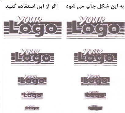
شکل ۳- مشکل عدم خوانایی در لوگوهای کوچک به علت چاقی ترام

خواهد شد. برای رفع این عیب اگر خط دور آرم هم‌رنگ با خود آرم باشد می‌توان از این مشکل جلوگیری کرد. نمونه شبیه‌سازی شده این وضعیت در شکل (۴) قابل مشاهده است.