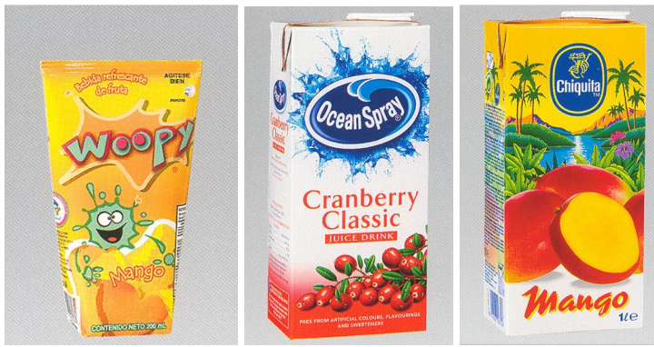
شکل ۱- استفاده از فضای ثابت در پشت آرم

از راست به چپ اولی: آب انبه محصول شرکت چیکیتا، آلمان بسته بندی تترابریک. دومی: آب کارنبری محصول شرکت اوشن اسپری، انگلستان، تترابریک اسپتیک. سومی: آب انبه محصول شرکت سوسایدد کوپراتیوا، کشور مکزیک، تترابریک اسپتیک