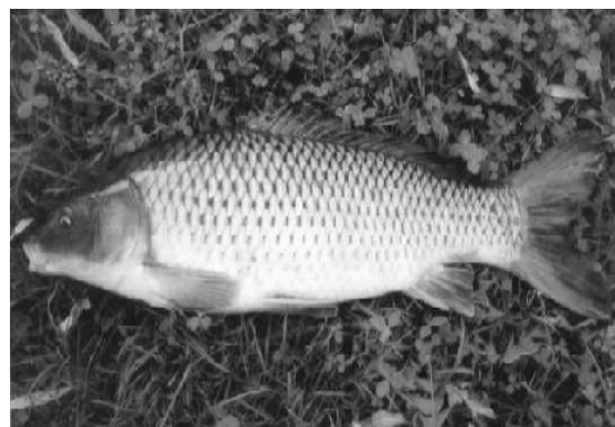
شکل ۲- ماهی کپور

سپس با نسبت ۱:۱ زیر یخ قرار داده شده و به کارخانه تهیه ماهی به منظور فیله شدن، و بسته‌بندی و انجماد انتقال داده شدند. بر این اساس، ماهی‌ها به صورت فیله‌های ۱۰۰ گرم در آورده شدند، نیمی از فیله‌ها به صورت معمولی با پلیاستیک فریزر بسته‌بندی گردیدند (شاهد) و نیمی دیگر را به وسیله دستگاه بسته‌بندی‌کننده تحت خلأ، (وکیوم‌کننده) با استفاده از نایلون، جنس PVDC ۲ (پلی‌وینیلیدین کلراید) با ضخامت ۱۷۰ میکرون که از فیلم‌های پلیاستیکی بسیار محافظ است و شکل‌پذیر بوده و توانایی تحمل دماهای پایین تجاری دیگر از کمترین قابلیت نفوذپذیری نسبت به بخار آب، اکسیژن و دی‌اکسید کربن دار است ۳ و در بسته‌های ۱۰۰ گرمی بسته‌بندی شدند.