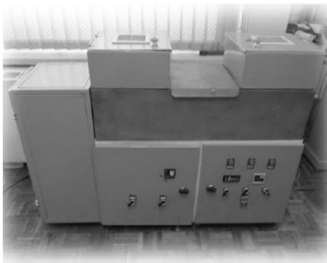
شکل ۲- دستگاه فرایند بسته‌بندی به روش EMI