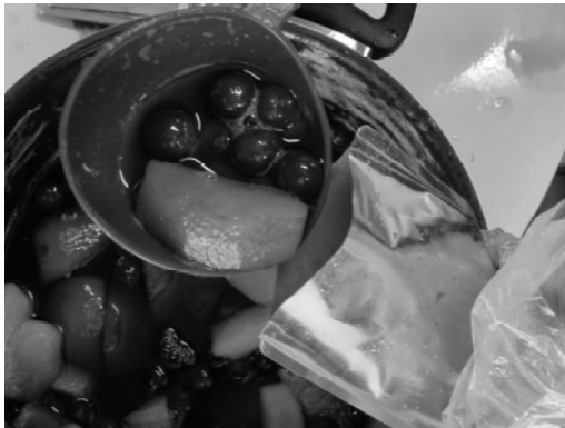
شکل ۳- پر کردن مواد غذایی در پاکت‌ها به روش دستی