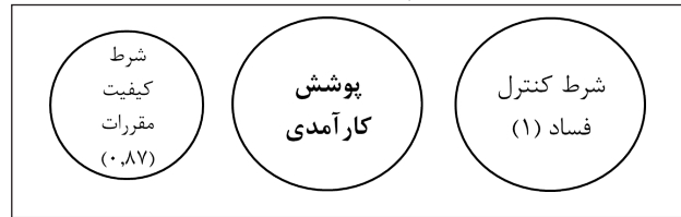
نمودار ۲- پوشش شروط

شکل زیر نیز نشان‌دهنده میزان پوشش و اهمیت این دو شرط است.