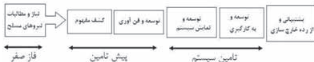
شکل ۳- نمونه‌ای از چرخه تامین در وزارت دفاع آمریکا [۴].

یکی از مسائل مهم و اساسی در برنامه‌های اکتساب (تامین) سلاح و تجهیزات نیروهای مسلح، درک صحیح و واقعی از نیازهای پنهان و آشکار کاربران عملیاتی است. فقدان چنین درک و فهمی از نیاز کاربران، کشور و به خصوص بخش دفاع را با مشکلات زیادی مواجه می‌سازد. بررسی‌ها و شواهد نشان می‌دهند که قبل از هرگونه اقدام عملی برای طراحی یک سامانه، لازم است خواسته‌های پنهان کاربران عملیاتی شفاف شوند. زیرا در اعلام نیاز کاربران، به طور معمول خواسته‌های پنهانی وجود دارند که بیان و یا آشکار نمی‌شوند. این خواسته‌ها، یکی از عوامل مهم طولانی شدن، هزینه‌بر شدن پروژه‌ها/ برنامه‌ها، و در نهایت، شکست احتمالی آن‌ها به شمار می‌روند. همین امر باعث گردیده است تا پروژه‌ها و طرح‌های تحقیقاتی و صنعتی فراوانی با هزینه‌های هنگفت تعریف و اجرا شوند، اما در تعریف و اجرای آن‌ها، کاربران عملیاتی کمترین نقش و سهم را داشته باشند. در نتیجه، محصولی که حاصل می‌شود، به طور معمول آن چیزی نیست که کاربران عملیاتی انتظار دارند [۵]. چالش دیگر پیش رو در زمینه نیاز نیروهای مسلح، آن است که