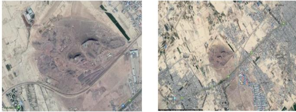
شکل (۱): تصاویر ماهواره‌ای

به سنگ بالاست و بخشی دیگر به پسماند تبدیل می‌شود و در نهایت طبق درخواست و نیاز مشتری سنگ بالاست یا پسماند مورد تقاضا به بارانداز ارسال شده و از این بخش به مشتری فرستاده می‌شود که مراحل در شکل ۱ نمایش داده شده است: