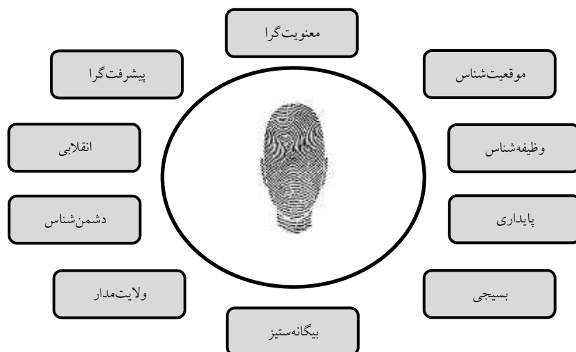
شکل ۱. تصویر الگوی هویتی معرفی شده برای جوانان در بیانات مقام معظم رهبری درباره دفاع مقدس

پژوهشگر بر حسب رویکرد نظریه‌مبنایی به منظور دستیابی به گزاره‌های نظری، باید مقولات و مؤلفه‌های جزئی را به مقولات کلی‌تر تبدیل، و سپس میان آنها ارتباط منطقی برقرار کند. در این رابطه در نظریه هویتی مقام معظم رهبری (مدظله) مؤلفه‌های دینی در مرتبه‌ای بالاتر از دیگر مؤلفه‌ها قرار دارد و در شکل‌گیری دیگر ابعاد هویتی فرد، نقشی اساسی ایفا می‌کند؛ به عبارت دیگر دیدگاه ایشان و برخلاف رویکرد دین‌ستیزانه الگوهای هویتی غربی و تبدیل دین به عنصری فردی و حاشیه‌ای، ایمان و معنویت، اصلی‌ترین عناصر سازنده هویت ملی جوان ایرانی است و دیگر وجوه هویت و شخصیت وی را تحت‌الشعاع خود قرار می‌دهد؛ بدین دلیل ضرورت حضور معنویت و ظهور آن در همه ابعاد حیات انسانی روشن، و اهمیت راهبردی معنویت در تعالی فرد و جامعه، مسئله‌ای آشکار است.