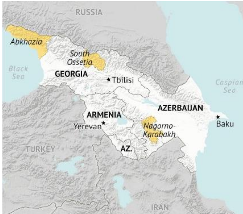
شکل شماره ۱. موقعیت کشورهای قفقاز جنوبی

منطقه قفقاز یکی از متنوع‌ترین مناطق جهان از حیث تنوع قومی است. بیش از ۵۰ گروه قومی را می‌توان در این منطقه مشاهده کرد. این گوناگونی قومی در قفقاز جنوبی چشمگیر بوده و همین موضوع از اصلی‌ترین دلایل ترسیم مرزهای سیاسی در قرن گذشته در این منطقه بوده است. ارمنی‌ها یکی از سه قومیت بزرگ این منطقه، به زبان هند و اروپایی صحبت می‌کنند و مسیحی مونوفیسیت (حواریونی) هستند. آذری‌ها به زبان ترکی تکلم دارند و عمدتاً مسلمان شیعه هستند (۷۵٪). گرجی‌ها زبان منحصر به فرد خود را دارند (زبان قفقازی) و اکثریت آن‌ها مسیحی ارتدوکس‌اند (بیش از ۹۵٪). در میان این سه جمهوری، فقط ارمنستان دارای جمعیت همگونی هست؛ مخصوصاً از زمانی که آذری‌ها در اواخر دهه ۸۰ مهاجرت کردند. در حال حاضر هم تعداد کمی از کردهای ایزدی در این کشور باقی مانده‌اند. اما آذربایجان و گرجستان، دولت‌های چندقومیتی هستند. همچنین اقلیت روسی هم در هر سه