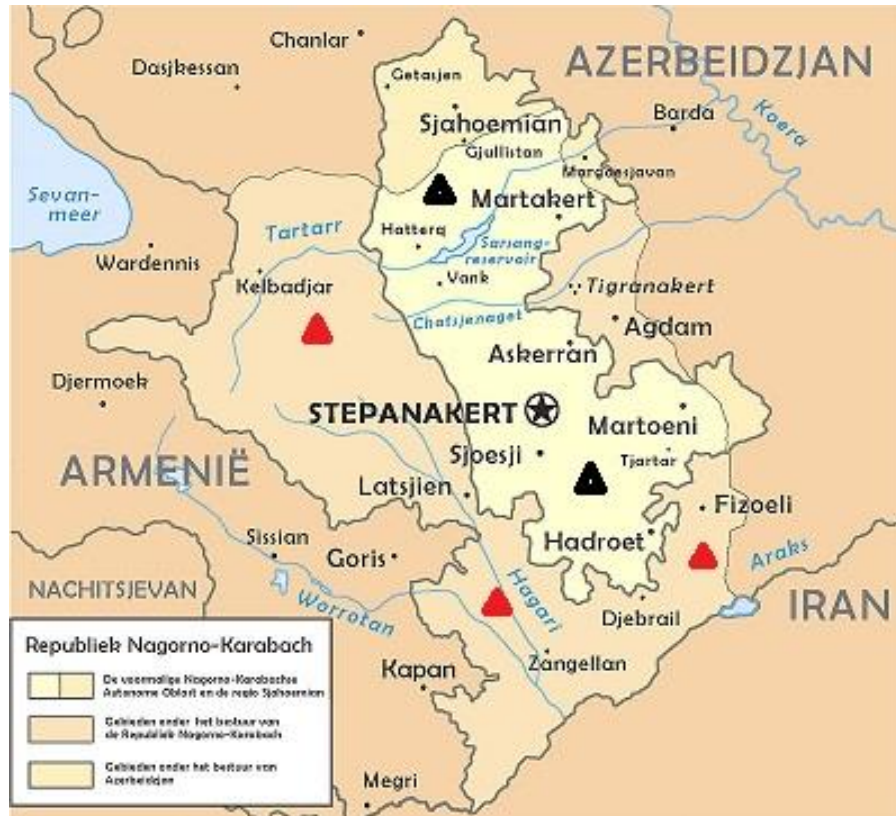
شکل شماره ۳: نوگورنو قره‌باغ به مرکزیت شهر استپاناکرت و شهرهای جمهوری آرتساخ (سابق) ۱