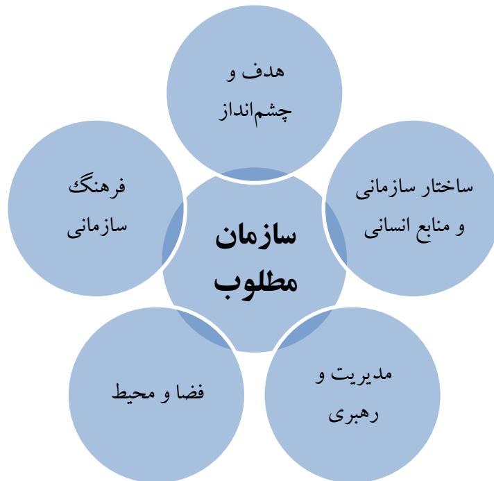
شکل ۲. ابعاد پیشنهادی سازمان مطلوب در تمدن نوین اسلامی

پژوهشگر نیز با بررسی منابع موجود در زمینه سازمان و آموزه‌های اسلامی و به منظور پوشش مطالب جمع‌آوری شده در این زمینه، تصویر سازمان مطلوب در تمدن نوین اسلامی را در ابعاد پنج‌گانه پیشنهادی زیر بیان کرده است. این ابعاد عبارتند از هدف و چشم‌انداز، ساختار سازمانی و منابع انسانی، مدیریت و رهبری، فضا و محیط و فرهنگ سازمانی (شکل ۲).