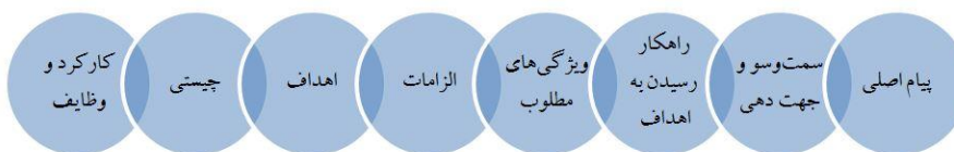
شکل ۲. رئوس اصلی موضوع رسانه در بیانات مقام معظم رهبری

برای فهم دقیق‌تر بیانات مقام معظم رهبری مضامین سازمان دهنده در شکل ذیل می‌آید: