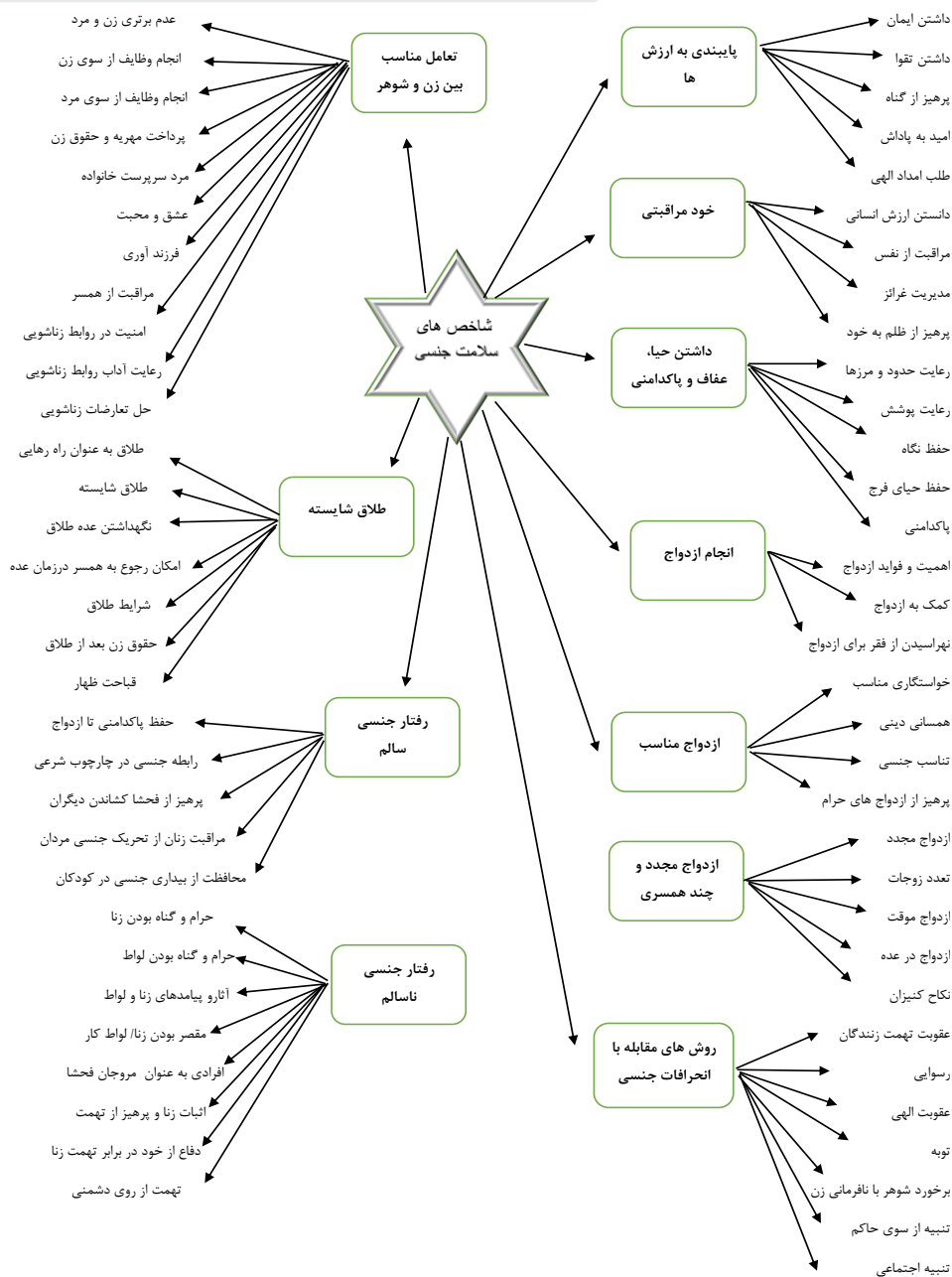
شکل ۱. شاخص های سلامت جنسی