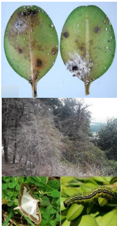
شکل (۱): طغیان آفت شب‌پره و بیماری بلایت شمشاد در جنگل‌های شمال کشور

بلعید. به این ترتیب که از میان ۸ هزار و ۵۰۰ هکتار شمشاد، ۵ هزار هکتار بر اثر بلایت از بین رفته و از حدود ۳ هزار و ۵۰۰ هکتار باقیمانده نیز ۳ هزار هکتار درگیر آفت شب‌پره شد [۲۷]. متأسفانه این آفت هم به برگ و هم به پوست درخت حمله می‌کند و زمانی که پوست درخت را خورد، آن درخت عملاً از فعالیت باز می‌ماند. این آفت مونوفاژ است یعنی تنها به گونه شمشاد حمله می‌کند [۲۸]. لازم به ذکر است در طی این مدت دفتر حفاظت و حمایت سازمان جنگل‌ها، مراتع و آبخیزداری کشور، مؤسسه تحقیقات جنگل‌ها و مراتع کشور، اداره کل مدیریت بحران استانداری مازندران راهکارها و طرح‌های مختلفی را برای کنترل بیماری بلایت ارائه و اجراء نموده‌اند که در بعضی موارد در سطح آزمایشگاهی و وسعت محدود نتایج رضایت‌بخشی داشت ولی در سطح وسیع مانع از پیشروی خسارت نگردید. در فقره خشکیدگی بلوط زاگرس نیز همانند خشکیدگی شمشاد، علت خشکیدگی، عوامل ثانویه هستند و باید به دلایل اصلی این موضوع پرداخته شود. لازم به ذکر است که در مورد خشکیدگی دو گیاه نام برده ردپای عوامل دیگری از جمله کشاورزی و چرای بی‌رویه در زیراشکوب جنگل، آتش‌سوزی، طبیعت‌گردی بی‌برنامه، نزولات کم و ... دیده می‌شود که پس از تضعیف درخت در طول زمان مانند یک بدن سرطانی، بیماری‌های ثانویه شیوع پیدا می‌کنند [۲۴].