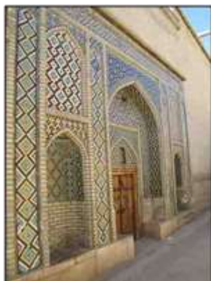
شکل ۱۶- نمونه‌ای از کاربرد رنگ در کاشی‌کاری‌ها و نماهای شهری

رنگ از جهات متعددی از قبیل حظ بصر و لذت ناظرین و ایجاد سرور و بهجت در آنان، هماهنگی با هویت و عملکرد پدیده و زمینه و... در تعریف و تفسیر زیبایی یک موضوع ایفای نقش می‌کند (نقی‌زاده، ۱۳۸۶: ۲۹۶) (شکل ۱۵). در شهرهای سنتی آنجا که نیاز به آرامش و سکون است، رنگ‌های سرد مثل سفید، آبی، سبز و... و آنجا که نیاز به شادی و سرزندگی است رنگ‌های گرم مثل زرد، قرمز و... استفاده می‌شود (شکل ۱۶). خانه محل آرامش است پس سفید است. مسجد محل آرامش روحانی و درعین حال نشاط معنوی است پس سبز زمردی و آبی لاجوردی و حتی زرد در آن به کار می‌رود. تک‌رنگ آبی کاشی سردر خانه‌ها در زمینه یک‌دست سفید یا نخودی می‌گوید خانه علاوه بر محل سکون بودن، محل تعالی است.