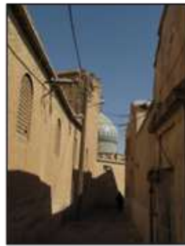
شکل ۱۱- گنبد، عنصر مسلط در شهرهای سنتی و نمادی از تجرد و معنویت، شیراز، ایران

در شهرهای سنتی احجام و فرم‌ها انسان را به‌صرف تماشای خویش دعوت نمی‌کردند، انسان با نگریستن در آن‌ها معنایی از حقایق را درک می‌کرد و آن‌ها وسیله‌ای بودند برای شناساندن مفاهیم متعالی، اما شهرهای امروزی سرشارند از فرم‌ها، اشکال و احجام مجسمه‌واری که به خویش، به‌مثابه یک بت، فرامی‌خوانند و نگاه انسان را از عالم افلاک به عالم خاک محدود می‌کنند و او را بیشتر به عالم مادیات گره می‌زنند (شکل ۱۳).