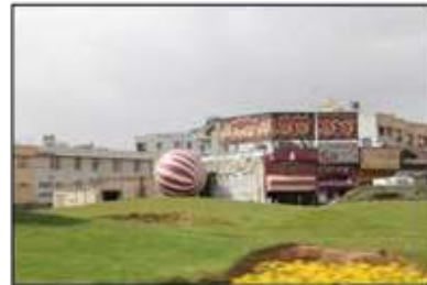
شکل ۷- عناصر [المان] فرمالیستی و فاقد عمق معنایی در «زیباسازی» شهر معاصر، شیراز، ایران