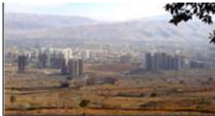
شکل ۱۰- گسست فضایی، پراکنده رویی، پاشیدگی کالبدی و تکه‌تکه بودن شهرهای معاصر، شیراز، ایران

قرار گرفته‌اند و با یکدیگر یک کل واحد را شکل داده‌اند. «ظهور وحدت در یک پدیده (اعم از وحدت بین اجزا آن و وحدت بین آن پدیده با سایر پدیده‌ها و با کل هستی) از مهمترین عواملی است که ظهور آن می‌تواند پدیده را به صفت زیبایی متصف گرداند» (نقی‌زاده، ۱۳۸۶: ۲۹۴). در شهرهای سنتی شهر برآمده از طبیعت بود، نه تحمیل شده بر آن، با آن در تعامل سازنده بود و جزئی تکمیل‌کننده به حساب می‌آمد. دیگر اینکه در خود شهر نیز، اجزای مختلف شهر از خانه گرفته تا خیابان‌ها و میدان، بازارها و مساجد، هیچ‌کدام بدون ربط و پیوستگی از هم نبودند و هرکدام در عین استقلال در یک پیوستگی معقول، کلیت و وحدتی را به نمایش می‌گذاشتند (شکل ۹). ولی شهرهای امروزی تکه‌تکه و ناپیوسته‌اند و به صورت یک کل واحد درک نمی‌شوند (شکل ۱۰). ارتباط آن‌ها با طبیعت نه تنها ارتباط یگانه‌تنی نیست که ارتباطی تخریب‌گرایانه است و نوعی نگاه چیره‌جویانه و تسلط‌طلبانه بر طبیعت دارند که این در تضاد با وحدت کلیه اجزای عالم هستی است.