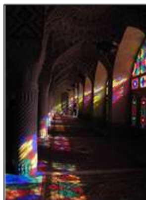
شکل ۱۵- نمونه‌ای از کاربرد نور و رنگ در مساجد تاریخی، شیراز