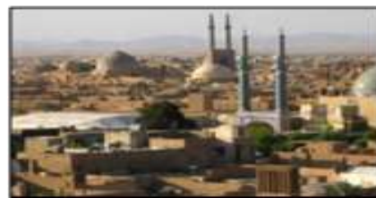
شکل ۹- انسجام، یکپارچگی و پیوستاری شهرهای تاریخی جلوه‌ای از ظهور وحدت، یزد، ایران