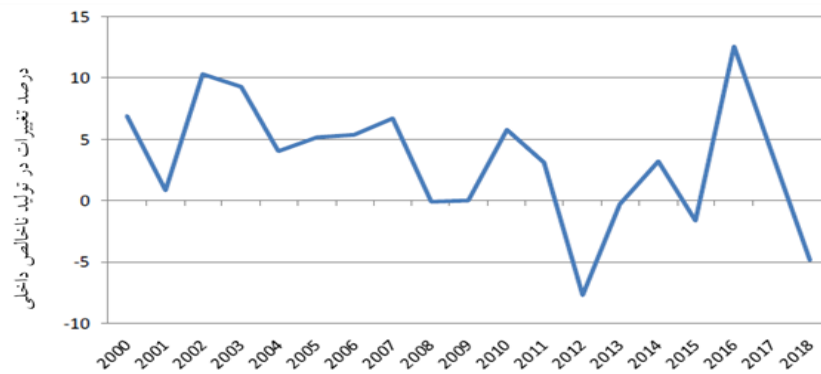
نمودار ۲. تولید ناخالص داخلی ایران (چودهری و همکاران، ۲۰۲۰: ۵)

تأثیر منفی تحریم‌ها در اقتصاد ایران، در رکود شاخص‌های کلیدی اقتصاد ایران نیز نقش داشت. در سال ۲۰۱۸ هنگامی که تحریم‌های آمریکا مجدداً اعمال شد، رشد تولید ناخالص داخلی ایران به ۴/۸- درصد کاهش یافت (صندوق بین‌المللی پول، ۲۰۱۹). این در حالی است که با کاهش تحریم‌ها پس از توافق برجام در سال ۲۰۱۵، تولید ناخالص داخلی ایران به ۱۲/۵ درصد افزایش یافته بود. نمودار زیر تأثیرگذاری تحریم بر رشد تولید ناخالص داخلی ایران را نشان می‌دهد.