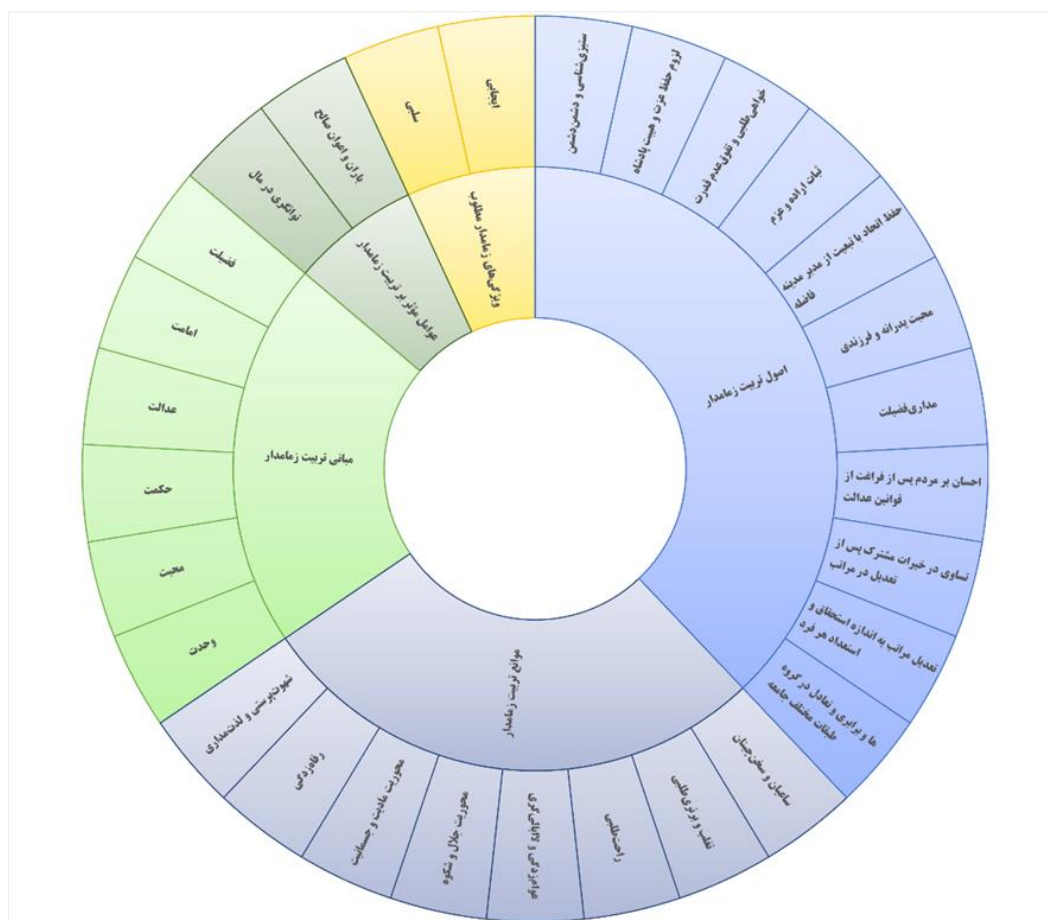
نمودار ۱. الگوی تربیت زمامدار در اندیشه خواجه نصیرالدین

در مقام جمع‌بندی اندیشه خواجه نصیرالدین می‌توان گفت الگوی تربیت زمامدار در اندیشه وی بر پنج رکن استوار است: فضیلت، امامت، حکمت، عدالت و محبت. فضیلت را می‌توان محور سه رکن حکمت، عدالت و محبت در نظر گرفت. به عبارت دیگر تربیت زمامدار در نگاه او