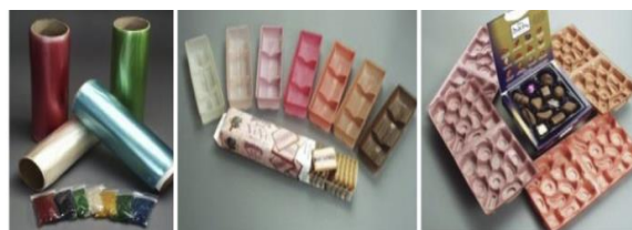
شکل (۲): محصولات تجاری مبتنی بر نشاسته

می‌شوند که در داخل سلولی به شکل گرانول‌های کروی با قطر ۲ تا ۱۰۰ میکرومتر ذخیره می‌شود. اکثر نشاسته‌های موجود در بازار از غلاتی مانند ذرت، برنج و گندم یا از غده‌هایی مانند سیب زمینی و کاساوا (تاپیوکا) استخراج می‌شوند. با بررسی ساختار، نشاسته یک پلیمر کربوهیدراتی متشکل از واحدهای انیدروگلوکز است که عمدتاً از طریق پیوندهای گلوکوزیدی آلفا-دی (۱-۴) به یکدیگر متصل شده‌اند [۲۳]. مطالعات قبلی نشان داده است که نشاسته یک ماده ناهمگن حاوی دو نوع ریزساختار است: خطی و شاخه‌ای. ساختار خطی به نام آمیلوز با واحدهای گلوکز با اتصالات آلفا (۱-۴) و ساختار منشعب به نام آمیلوپکتین که از زنجیره‌های کوتاه با اتصالات آلفا (۱-۴) گلوکز، که توسط پیوندهای آلفا (۱-۶) به هم متصل شده‌اند،