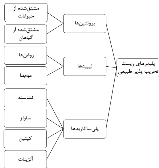
شکل (۱): منابع طبیعی پلیمرهای زیست‌تخریب‌پذیر

بسته‌بندی مصنوعی اهمیت پیدا کرده‌اند. این مواد پایدار، گاهی اوقات، همراه با محصول مصرف می‌شوند یا می‌توانند توسط میکروارگانیسم‌ها بدون تولید انتشارات محیطی خطرناک تجزیه شوند [۸]. چندین ماده بیولوژیکی مانند پروتئین‌ها، پلی‌ساکاریدها، لیپیدها و غیره در مقالات گزارش شده‌اند که می‌توانند برای توسعه بسته‌بندی‌های زیست‌تخریب‌پذیر استفاده شوند [۹]. به‌طور کلی پلیمرهای زیستی (طبیعی) رایج که برای تهیه پلاستیک‌های زیست‌تخریب‌پذیر استفاده می‌شود در شکل (۱) آورده شده است [۱۰].