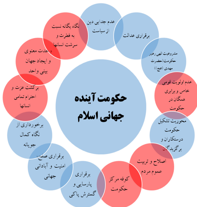
شکل شماره ۲. ویژگی‌ها و اهداف تشکیل حکومت واحد جهانی اسلام در آینده

پس از بررسی ویژگی‌ها و اهداف مدنظر حکومت جهانی یهود و اسلام که به واسطه ظهور موعود آخرالزمانی در ابعاد مختلف محقق می‌گردد، هر دو حکومت به ترتیب دارای ویژگی‌های مشترک و همچنین تفاوت‌هایی می‌باشد که به ترتیب در شکل‌های ۳ و ۴ نمایش داده شده است.