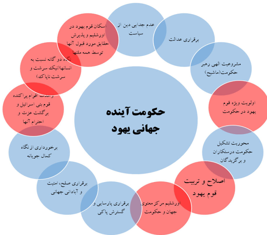
شکل شماره ۱. ویژگی‌ها و اهداف تشکیل حکومت واحد جهانی یهود در آینده

ویژگی، هفت ویژگی مشترک و شش ویژگی متفاوت می‌باشد که در شکل‌های شماره ۱ و ۲ نشان داده شده است؛ دایره‌های آبی رنگ اشتراکات و دایره‌های قرمز رنگ تفاوت در ویژگی‌ها را نشان می‌دهد: