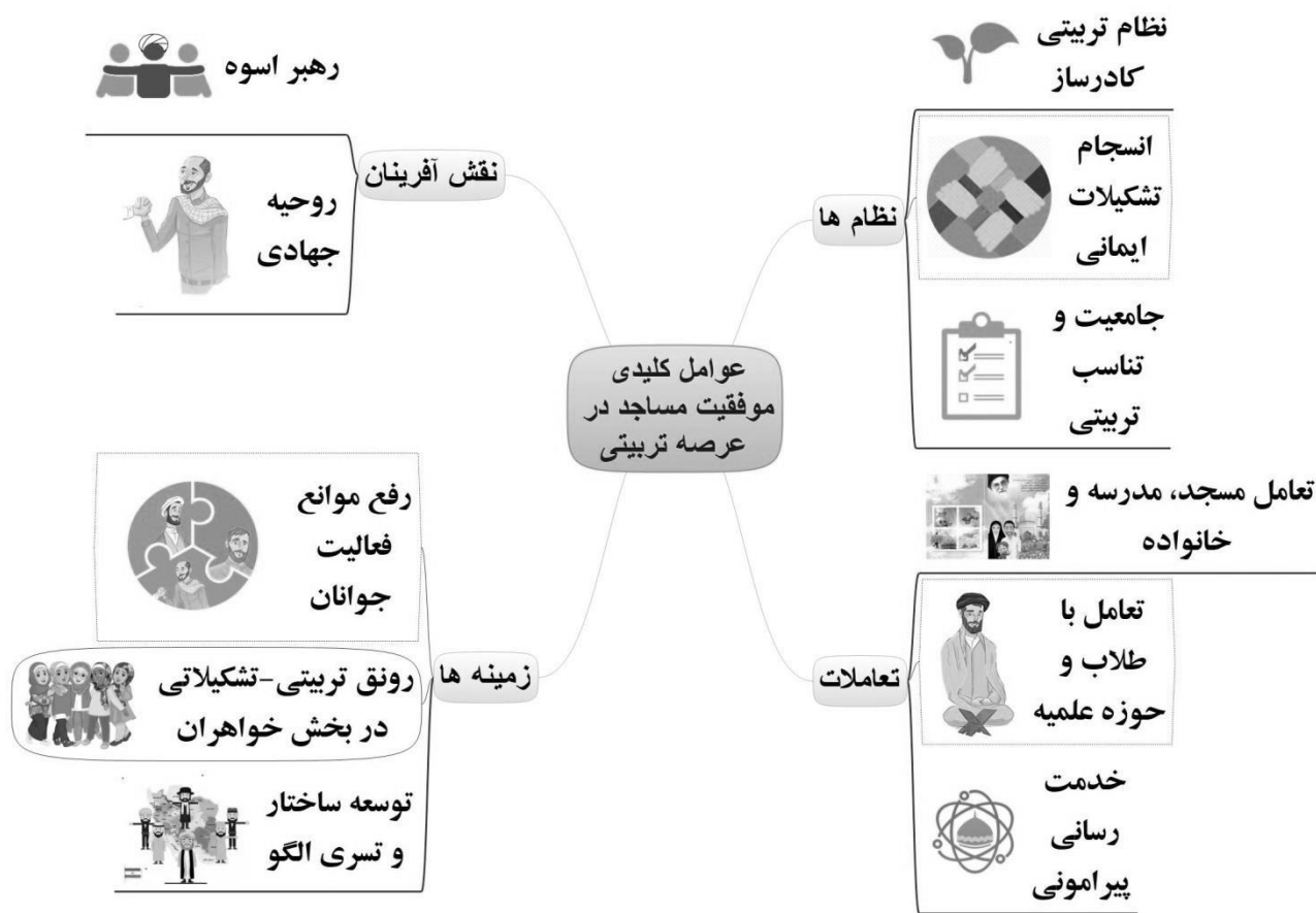
نمودار ۲: شبکه مضامین عوامل کلیدی موفقیت مساجد در عرصه تربیتی