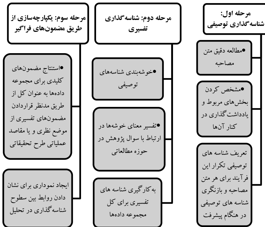
شکل ۱: فرآیند تحلیل مضمونی

در گام دوم سخنان مقام معظم رهبری در بازه زمانی بحران مورد بررسی قرار گرفت. در این مرحله تمرکز اصلی بر سخنانی بود که بیشتر در حوزه مدیریت بحران ایراد شد که به نوعی از ارکان مدیریت بحران است. روش تحقیق این فرایند بر راهبرد تحلیل مضمون مبتنی می‌باشد. کینگ و هاروکز ۱ در سال ۲۰۱۰ با بررسی و جمع‌بندی تلاش‌های دیگر پژوهشگران تحلیل مضمون، فرایند سه مرحله‌ای را برای تحلیل مضمون ارائه کرده‌اند که در این تحقیق نیز از این فرایند استفاده می‌شود این فرآیند شامل سه مرحله شناسه‌گذاری توصیفی ۲ ، شناسه‌گذاری تفسیری ۳ و یکپارچه‌سازی از طریق مضمون‌های فراگیر ۴ است که در شکل (۱) آمده است.