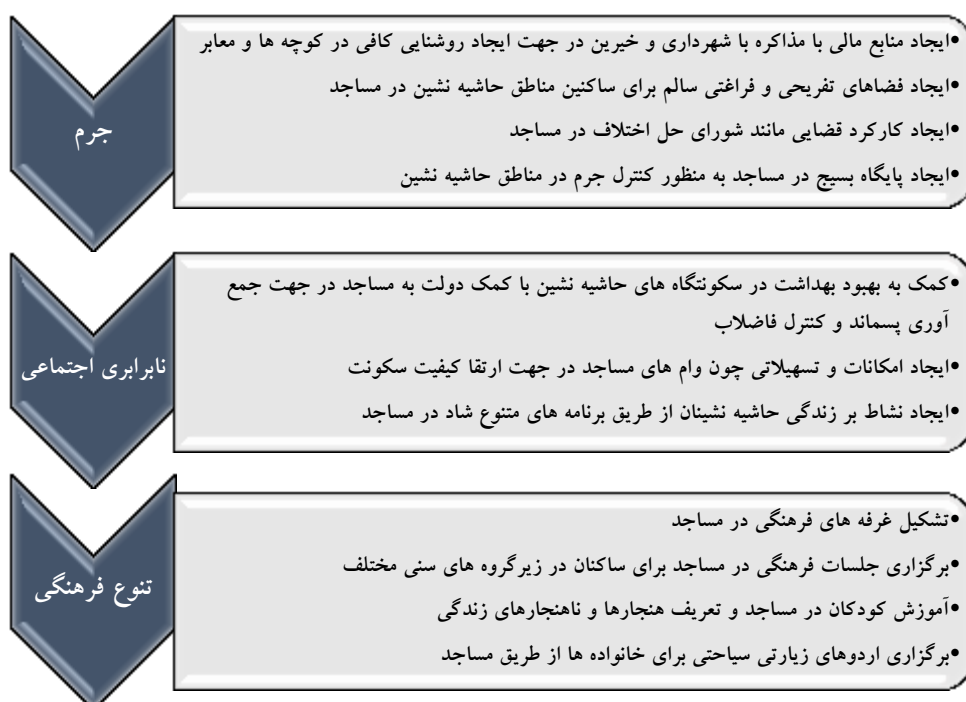
شکل ۳-۴- معضلات حاشیه نشینی و راهکارهای مسجدمحوری از نگاه اساتید دانشگاه

در مصاحبه با اساتید دانشگاه، مشکلات حاشیه نشینی را جرم، نابرابری اجتماعی و تنوع فرهنگی اعلام نمودند. همچنین راهکارهای پیشنهادی در جهت عملکرد مسجد را به شرح شکل ۳-۴ ارائه دادند.