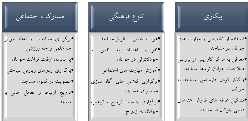
شکل ۴-۴- معضلات حاشیه‌نشینی و راهکارهای مسجد محوری از نگاه نخبگان

در مصاحبه با نخبگان در حیطه مسجد محوری، تاکید بیشتر نخبگان در اهمیت جذب جوانان به مسجد و اهمیت نقش آنان در جامعه و به عنوان نسل آینده کشور بوده است. شکل ۴-۴، معضلات حاشیه‌نشینی و راهکارهای مسجد محوری از نگاه نخبگان را نشان می‌دهد.