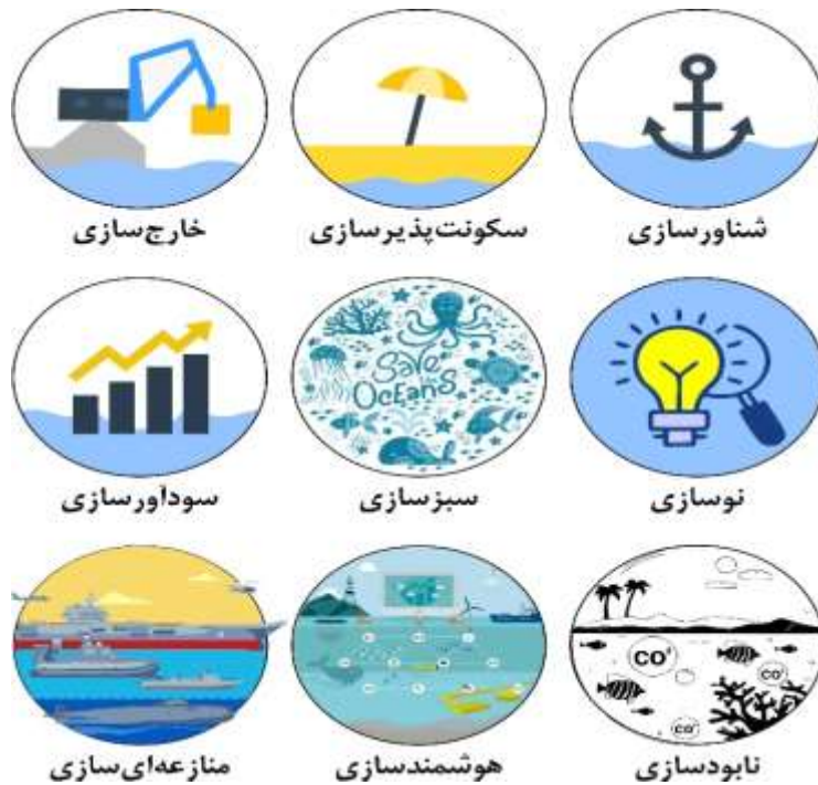
شکل ۲. کلان‌روندهای اقتصاد آبی

در نتیجه، ۶ کلان‌روند اصلی اقتصاد آبی، استخراج شد که در تصویر زیر ارائه شده است و در ادامه، توضیح کلی هر یک از این کلان‌روندها، ارائه خواهد شد.