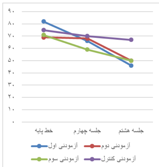
نمودار ۲. سنجش آزمودنی ها در پرسشنامه واکنش پذیری دیویس (متغیر واکنش پذیری بین فردی)

جدول (۳) و نمودار (۲) به تغییر روند نمره آزمودنی ها در پرسشنامه واکنش پذیری بین فردی دیویس در مراحل خط پایه، مداخله و جلسه آخر پرداخته شده است. آزمودنی اول نمره ۸۲، ۶۶ و ۴۶ را به ترتیب برای مرحله خط پایه، جلسه چهارم و جلسه آخر اخذ نمود. آزمودنی دوم در مرحله خط پایه نمره ۶۹ را کسب نمود و در جلسه چهارم نسبت با خط پایه تغییر چندانی نداشت و نمره ۶۸ را اخذ کرد اما در جلسه آخر نمره او کاهش یافت و به ۵۰ رسید. آزمودنی سوم نیز در مرحله خط پایه، جلسه چهارم و جلسه هشتم به ترتیب نمرات ۷۱، ۵۹ و ۵۹ را کسب نمود. در مؤلفه درماندگی شخصی نیز این آزمودنی در مرحله خط پایه نمره ۲۱، در جلسه چهارم نمره ۲۰ و در جلسه آخر نمره ۱۳ را کسب نمود. همچنین درصد بهبودی بالینی معنادار نیز در متغیر واکنش پذیری بین فردی برای آزمودنی اول ۴۳/۹۰، آزمودنی دوم ۲۷/۵۳ و برای آزمودنی سوم ۲۹/۵۷ می باشد. آزمودنی کنترل در مرحله پیش آزمون نمره ۷۵ را کسب نمود و در مرحله پس آزمون نمره ۶۷ را اخذ کرد، درصد بهبودی بالینی معنادار برای آزمودنی کنترل در متغیر علائم پس آسیبی