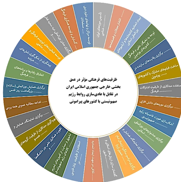
شکل ۲. مدل مفهومی تحقیق