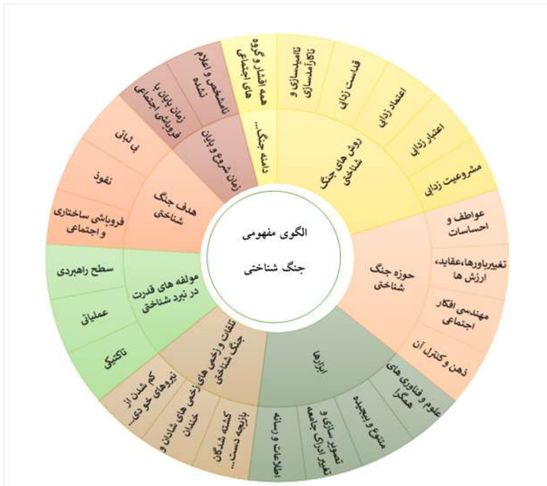
شکل شماره ۳: الگوی مفهومی جنگ شناختی (برگرفته از ادبیات نظری پژوهش)

نوظهور و رسانه‌های نوین ارتباطی توانسته است ابعاد آن را گسترده‌تر و اشکال آن را پیچیده‌تر نماید. (لطیفیان، کریم و همکاران، ۱۴۰۰: ۱۵۴). بر اساس ادبیات نظری پژوهش می‌توان الگوی مفهومی جنگ شناختی را در نمای شماتیک زیر مشاهده کرد.