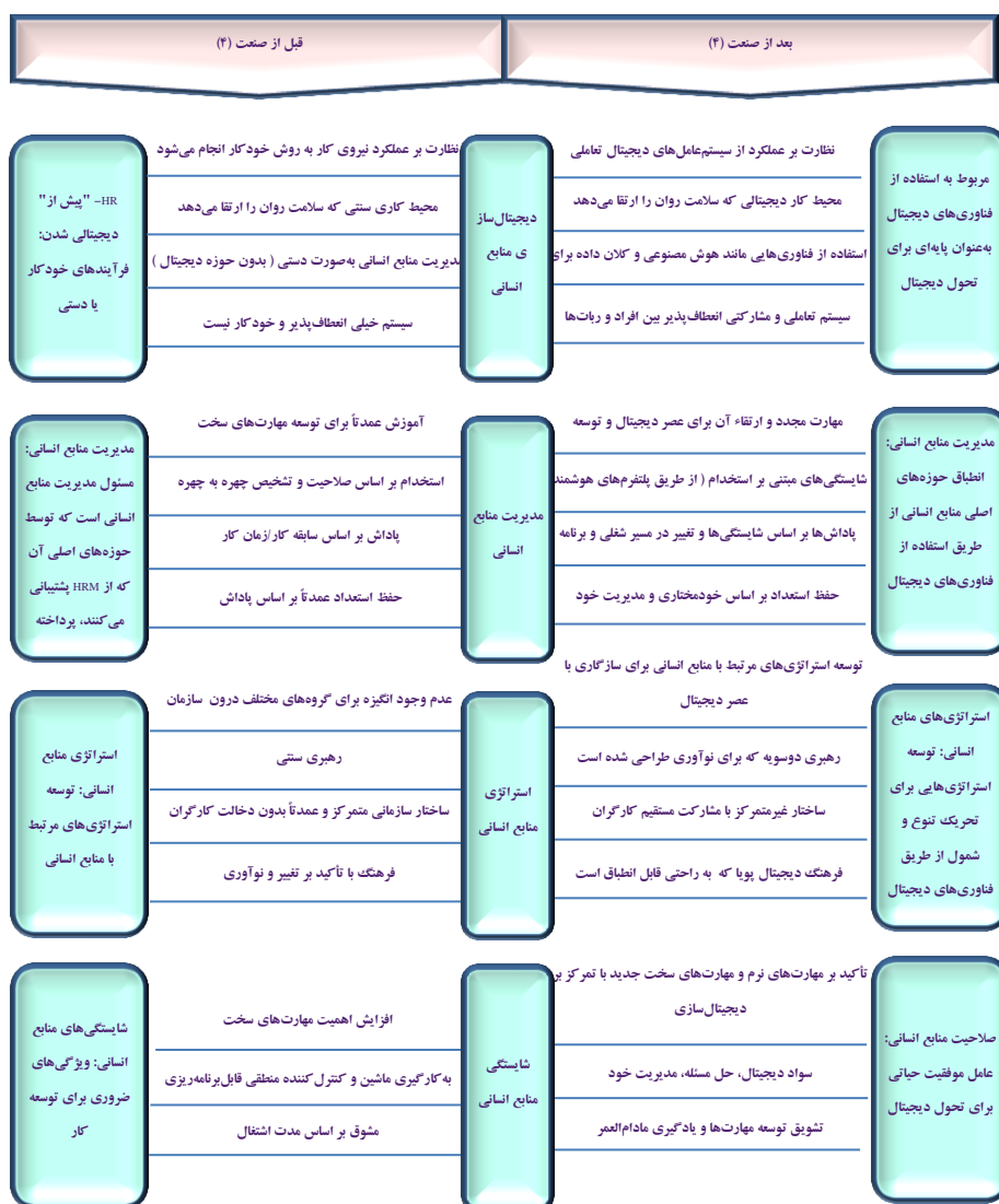
شکل ۲. تحول در منابع انسانی قبل و بعد از صنعت نسل (۴)

توسط تجربه شغلی، مهارت‌ها و مؤلفه‌های شخصی تعریف گردد (درسلهاوس ۱ ، ۲۰۱۰: ۲۰). تحولات مهمی در زمینه مؤلفه‌های منابع انسانی، قبل و بعد از صنعت نسل (۴) انجام شده است. شکل (۲) بیانگر این تحولات و به ویژه شایستگی‌های منابع انسانی است: