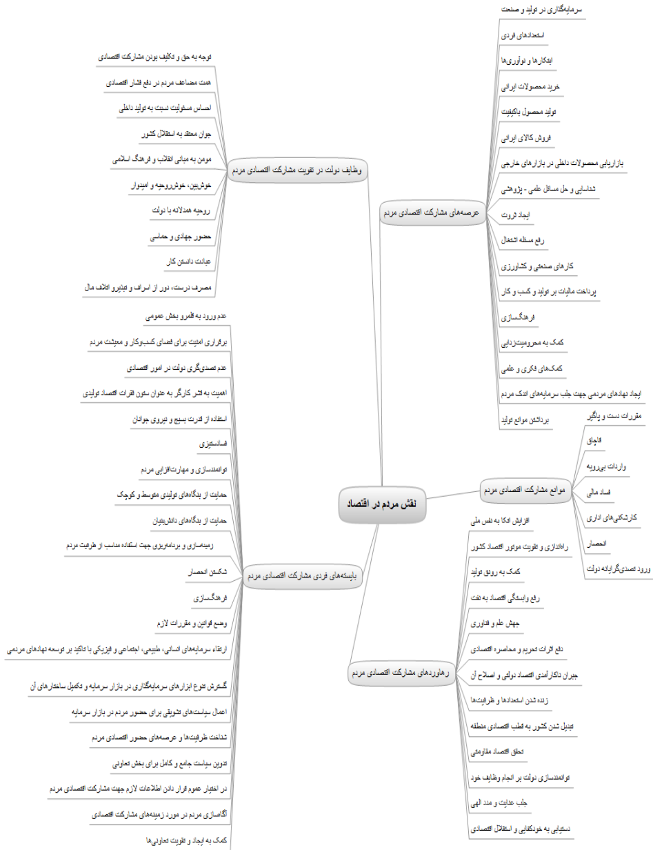
شکل ۲. نمودار درختی مضامین استخراج شده از بیانات مقام معظم رهبری مدظله‌العالی