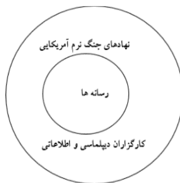
شکل ۱. تاکتیک برجسته‌سازی در مذاکرات هسته‌ای

با توجه به پژوهش موردنظر، در مذاکرات هسته‌ای، طرفین مذاکره بارها در جنگ رسانه‌ای خود با برجسته‌سازی اقدامات و تحرکات، پیشبرد اهداف را فراهم می‌ساختند. براساس این نظریه عوامل اجراکننده عملیات روانی بر عهده دو گروه کلی رسانه‌ها و بخش دیپلماسی، اطلاعاتی و نهادهای جنگ نرم آمریکا بود. در واقع این دو عوامل نقش عوامل برون‌سازمانی و درون‌سازمانی نظریه برجسته‌سازی را ایفا کرده‌اند. رمز موفقیت این دو عامل در همپوشانی و تعامل راهبردی با هم است. ادعایی که در ادامه با تحلیل محتوایی عملکرد کارگزاران جنگ نرم آمریکا با بهره‌گیری از سازوکارهای عملیات روانی مورد ارزیابی قرار گرفته است. در یک جمع‌بندی کلی از بحث نظری این مقاله می‌توان گفت ساخت آگاهی عمومی مرتبط با موضوعات بازیگران از محیط بین‌الملل و رفتار دیگران متأثر از تجربه و زمینه تاریخی آن‌ها نسبت به «خود» از «دیگران» است. در چنین شرایطی، مسئله‌سازی، دوستی و دشمنی را خود دولت‌ها بنا بر محیط ذهنی خویش که انباشته از تجربیات زمینه‌مند است، تعریف می‌کنند. مطابق با این طرز فکر وجود یک سلاح در دست یک دوست، متفاوت از وجود همان سلاح در دست دشمن است. آمریکا با استفاده از ظرفیت‌های داخلی و بین‌الملل خود نسبت به ایجاد ساخت عمومی موضوعات برای مواجهه یا فعالیت‌های هسته‌ای ایران و به‌ویژه مذاکرات هسته‌ای اقدام کرده است.