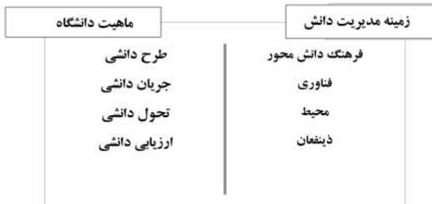
شکل ۲. ارائه الگوی مدیریت دانش در دانشگاه‌ها

پژوهش حاضر با هدف بررسی پژوهش‌های مربوط به الگو یا مدل مدیریت دانش در دانشگاه‌ها به روش فراترکیب کیفی انجام شده است. شکل ۲- خلاصه مهمترین نتایج پژوهش را در بعد اصلی ماهیت دانشگاه و زمینه مدیریت دانش گزارش می‌کند.