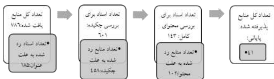
شکل ۲. روند جست‌وجو و انتخاب مقالات مناسب جهت تحلیل فراترکیب کیفی

تعداد کل مقالات و اسناد اولیه ۷۸۶ مقاله بوده است. این تعداد اسناد بعد از بررسی و پالایش بر اساس عنوان، تعداد ۱۸۵ مقاله از آن‌ها رد شد. در ادامه از تعداد ۶۰۱ مقاله باقیمانده، تعداد ۴۵۸ عدد دیگر نیز بر اساس عدم تناسب چکیده با اهداف پژوهش رد شدند. از تعداد ۱۴۳ مقاله باقیمانده ۱۰۲ مقاله دیگر نیز بر اساس محتوا حذف شدند. در شکل ۱- روند انتخاب ۴۱ مقاله پایانی جهت تحلیل فراترکیب عنوان شده است.