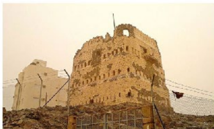
نمایی از بقایای قلعه‌های قبیله بنی‌نضیر در مدینه

پیوست شماره یک در خصوص مکان رویداد تاریخی حشر بنی‌نضیر: