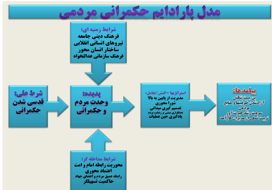
شکل ۲. مدل تبیین کننده حکمرانی مردمی بر اساس تجربه جهاد سازندگی