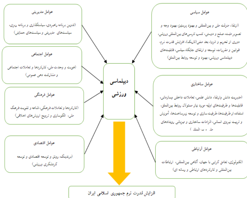
شکل ۳. الگوی کیفی بهره‌مندی از دیپلماسی ورزشی در افزایش قدرت نرم آینده جمهوری اسلامی ایران (منبع: یافته‌های پژوهش).

الگوی کیفی ابعاد دیپلماسی ورزشی بر افزایش قدرت نرم آینده جمهوری اسلامی ایران، با استفاده از مولفه‌های استخراج شده از مطالعات منتخب، طراحی و تدوین گردید. (شکل ۳)