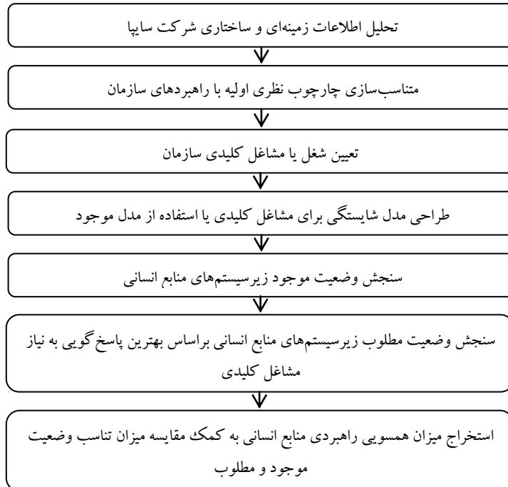
نمودار ۲. چارچوب مفهومی پژوهش