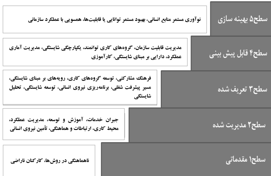
شکل ۱. مدل بلوغ قابلیت نیروی انسانی

سازمان را که در آن نیروی کار رشد می‌کند، بالاتر می‌برد. در چنین محیطی، افراد شانس بیشتری برای رشد توانایی حرفه‌ای پیدا می‌کنند و برای همسو کردن عملکرد خود با مقاصد سازمان، انگیزه بیشتری می‌یابند (کرتیس و همکاران، ۲۰۰۲: ۱۵).